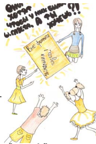
Реклама 6«Б» класса