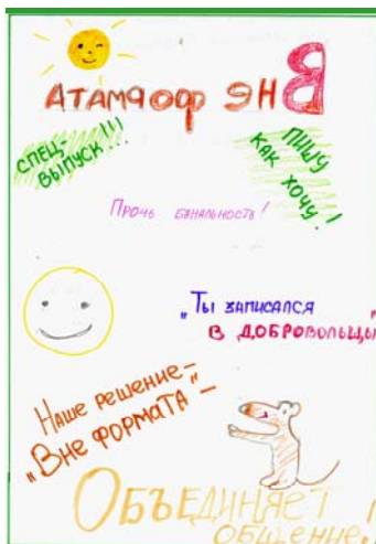
Реклама 6 «А» класса

Команды, участвовавшие в конкурсе «Сам себе ... журналист», создавали рекламу школьной газете. Вы можете познакомиться с лучшими работами