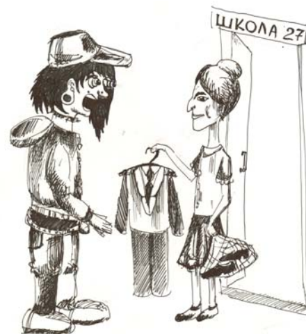
Рисунок Лавровой Екатерины, 11 "А"