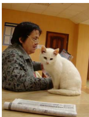
Всегда на посту