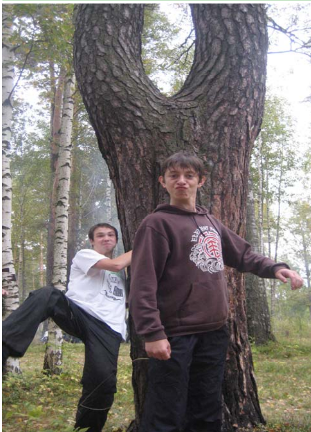
«А он подкрался незаметно» 11 класс

Если вы любите фотографировать, если свой сотовый телефон вы не всегда используете по прямому назначению – значит вы «НАШ» человек.