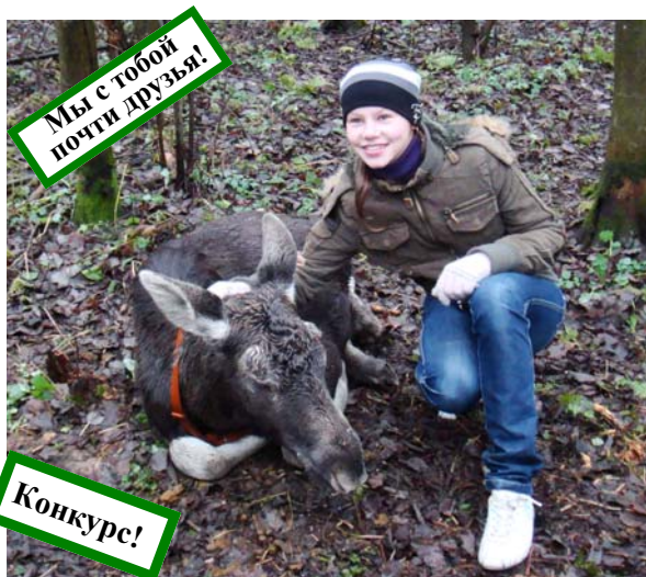
Кострома. На лосеферме.