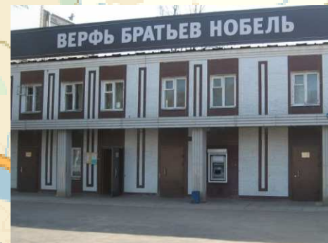
Верфь братьев Нобель